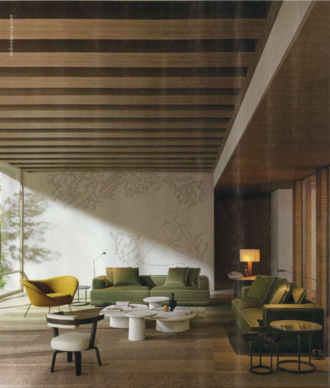
D.154.2 ARACCHIAIR — GIO PONTI